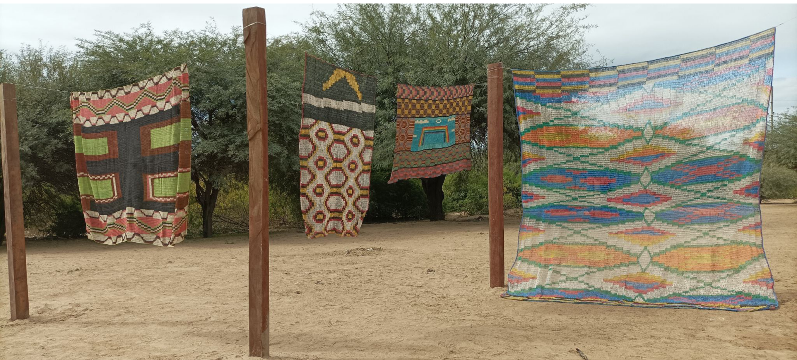
La escucha y los vientos, exposiciones en comunidades Wichí de Santa Victoria Este, Salta, Argentina. 2021-2022.