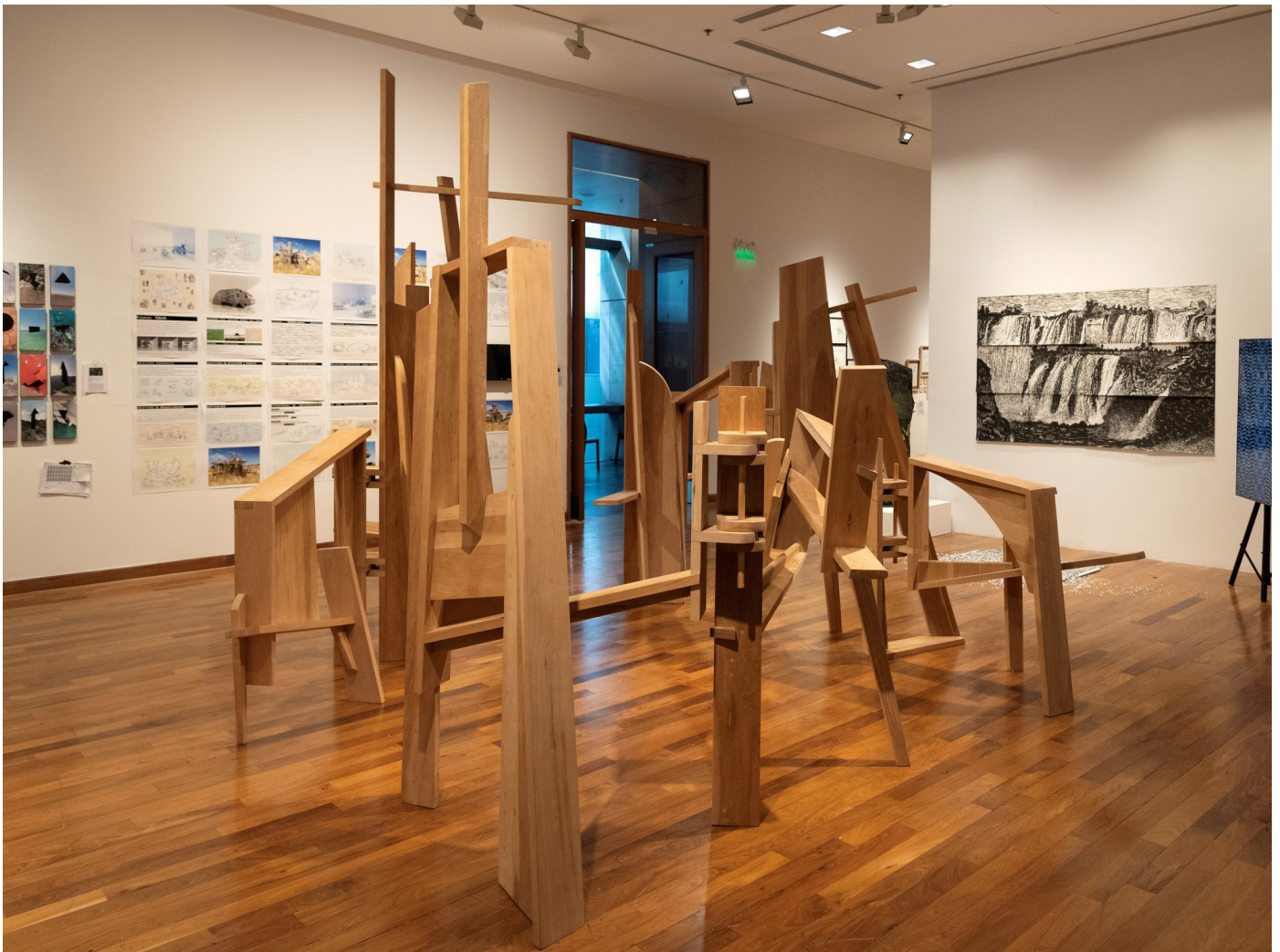
110 Salón Nacional de Artes Visuales, Centro Cultural Kirchner, 2022.