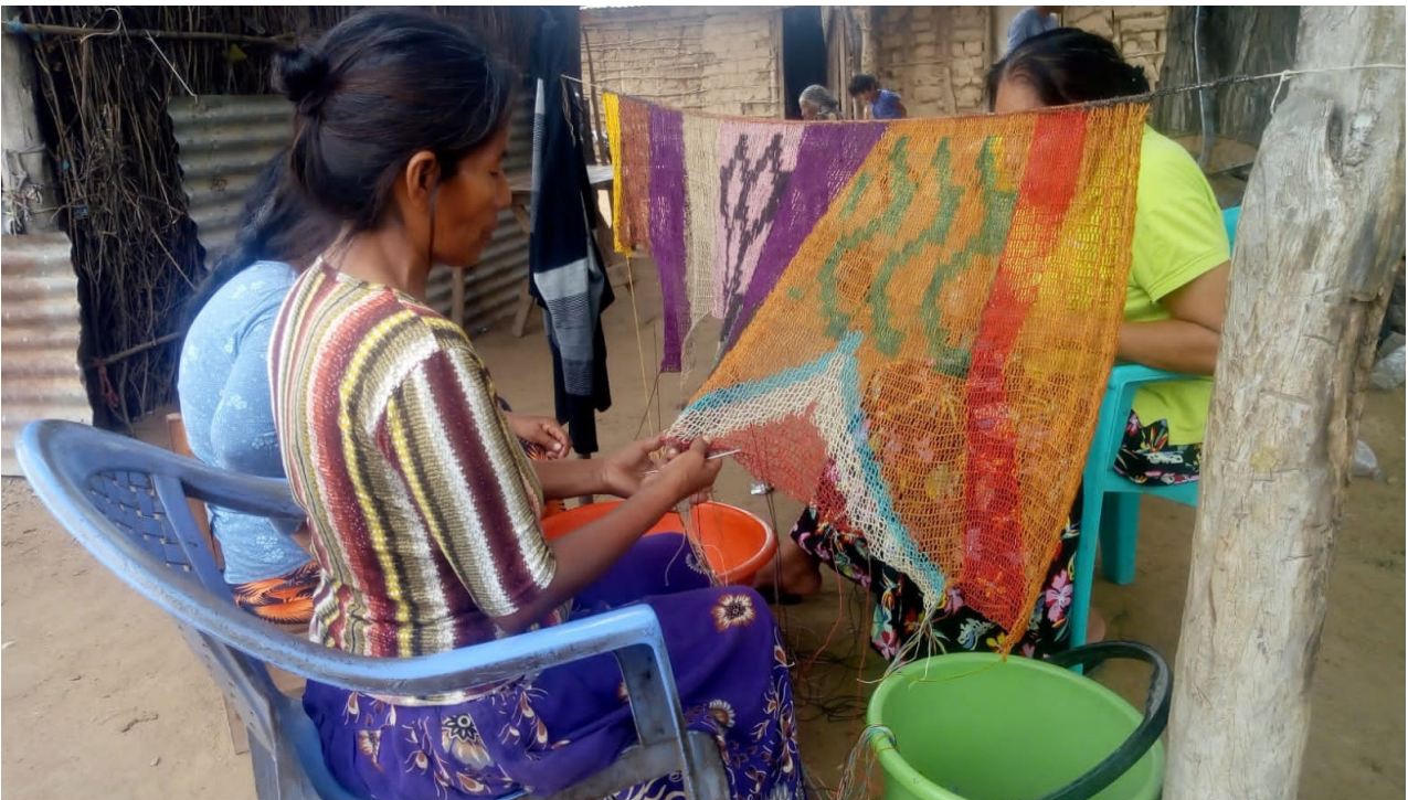
Proceso de tejido colectivo en fibra de chaguar. Grupo Silat, Comunidad La Puntana, Santa Victoria Este, Salta.

Dialogamos en terrenos preexistentes sobre los que se sembraron jardines donde florecen voces que son redes para ornamentar o transportar. Cuchicheos que traen al abrigo en forma de envolturas multicolores, que hacen presentes mensajes vitales, para ser usadas en los cuerpos y en los espacios que habitamos. El sonido de fondo en nuestras charlas transtemporales está compuesto por el canto de las palas del telar, el agua rompiendo hervor al fuego, el balido de las cabras, el rugir del viento, las alas agitadas de las aves, el cauce cristalino y turbio de los ríos, las risas infinitas y un sinfín de gestos de agujas, hilos, bastidores y tijeras que permiten ampliar la escucha hacia una verdadera unión que nos aliente a crecer.