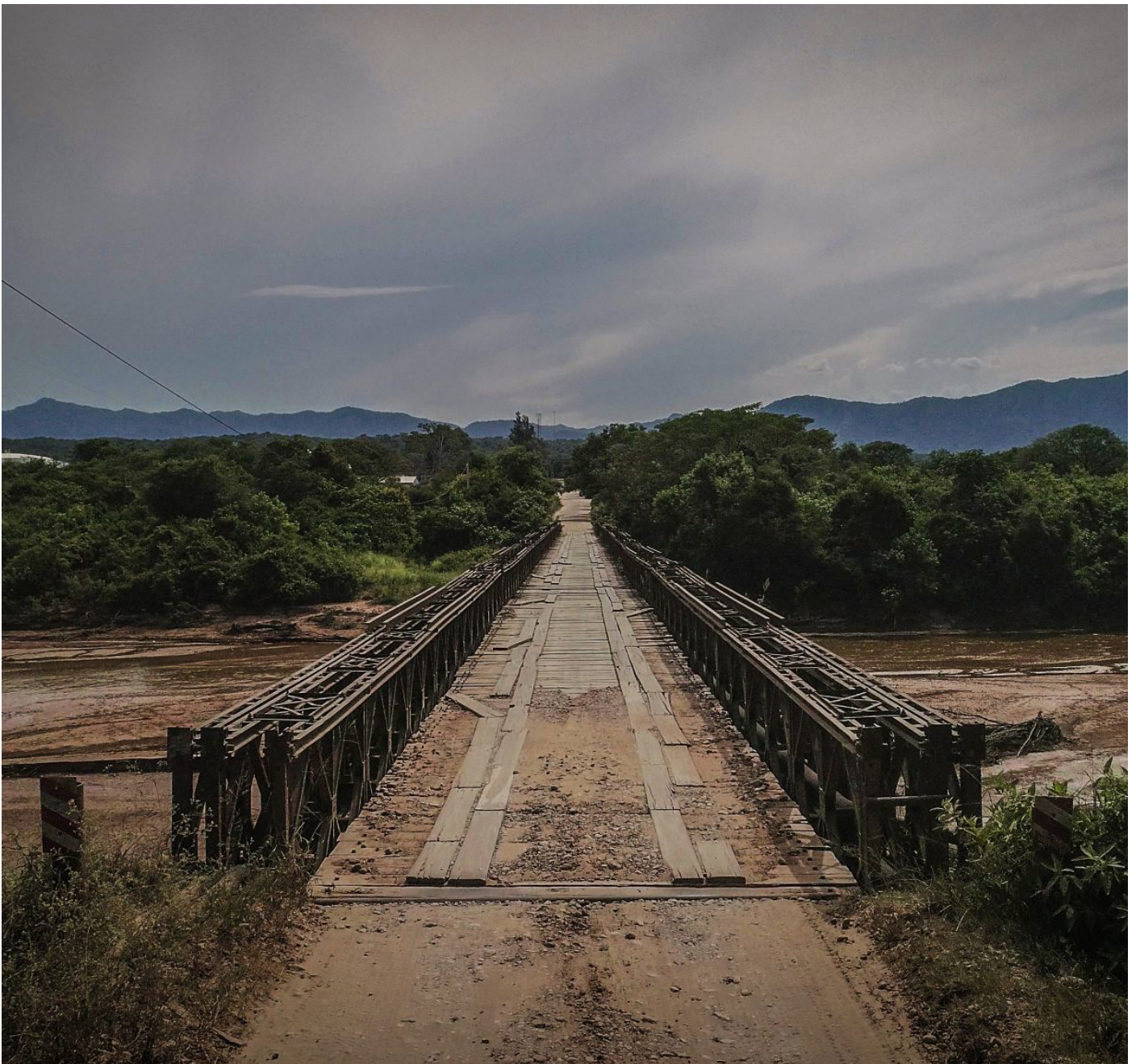
Still del audiovisual "Territorio" de Brayan Sticks, perteneciente al proyecto La Escucha y Los vientos. 2020.

En el año 2015 comencé a trabajar como técnica territorial en proyectos de instituciones estatales de Argentina con artesanas de comunidades indígenas, a las que acompañé en diferentes procesos de organización y proyectos de economía social. En 2019 tenté llevar algo de ese trabajo al mundo del arte contemporáneo con el proyecto "La escucha y los vientos" a partir de la invitación de la ifa-Galerie de Berlín a pensar un proyecto expositivo con mujeres de pueblos originarios dentro del programa Untie to Tie . Expusimos posteriormente "La escucha y los vientos" en el Museo de Bellas Artes de Salta como apertura de la Bienalsur 2021 que organiza la Universidad Tres de Febrero y en el Museo del Barro de Asunción y a fin de ese mismo año realizamos una edición de esta propuesta en la sede de la organización indígena Lhaka Honhat en Santa Victoria Este (Salta, Argentina), una exposición abierta en la que se sumaron mujeres de diferentes comunidades del chaco salteño y fue un espacio para el intercambio de experiencias, sentires sobre la comprensión de la vida, los vínculos interespecie y también se realizó la venta de trabajos artesanales a modo de feria.