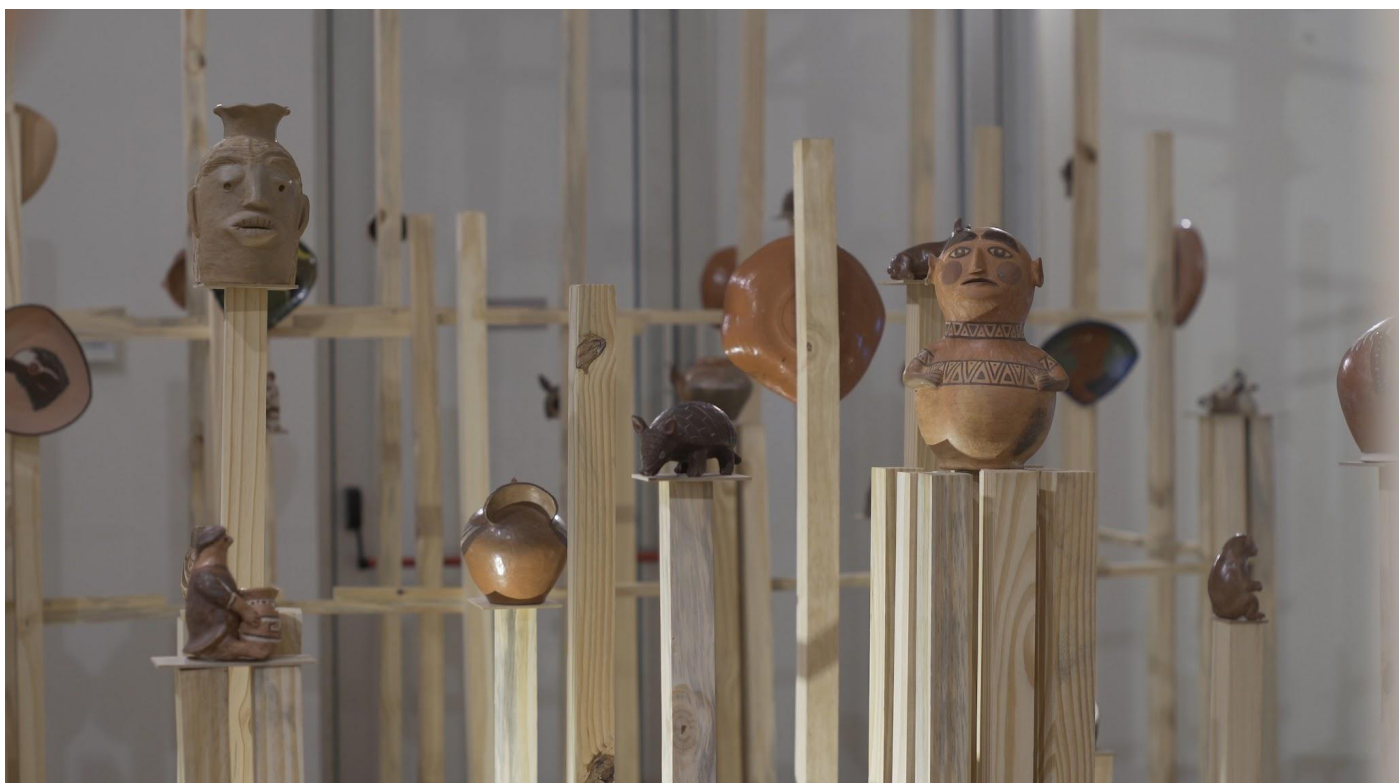
Registros de la exposición La escucha y los vientos. Relatos e inscripciones del Gran Chaco, en el marco de la tercera edición de BIENALSUR. Museo Provincial de Bellas Artes Lola Mora, Salta, Argentina. 2021.