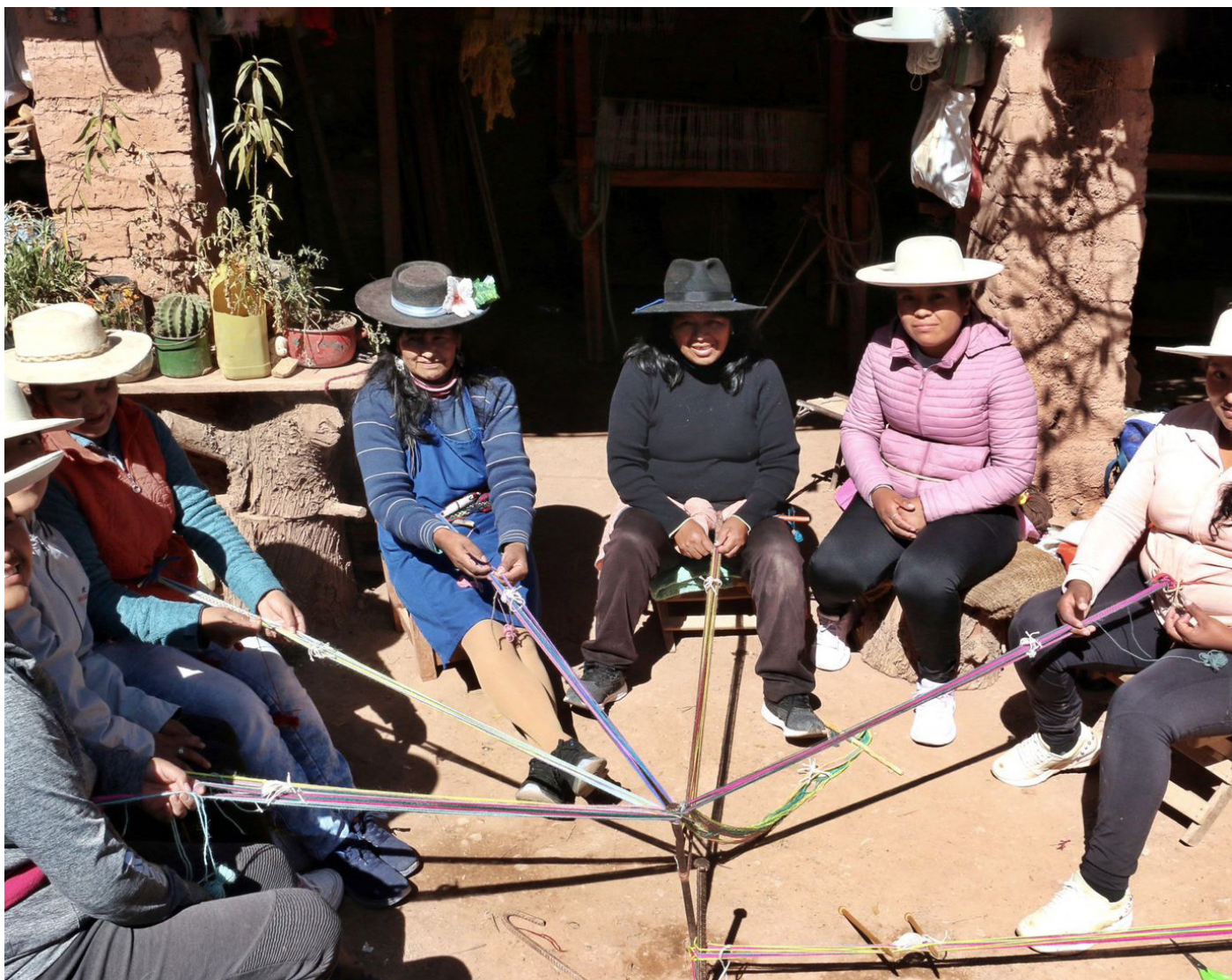
Ronda de tejido en telar de cintura del grupo Tejedores Andinos, de Huacalera, Provincia de Jujuy.