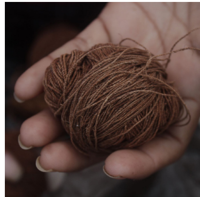
Elaboración de fibras textiles con la planta de chaguar (bromelia hieronymi)