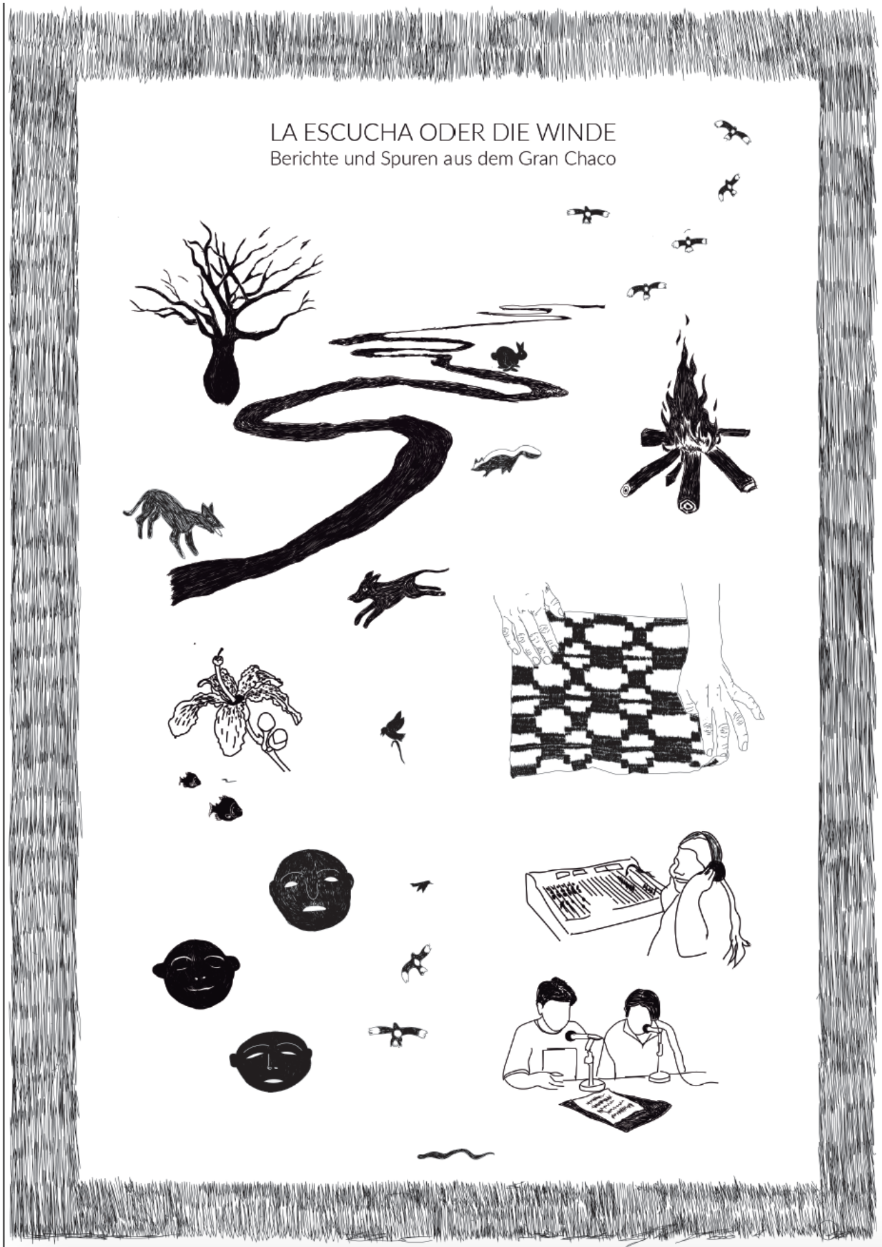
Catálogo de la exposición La escucha y los vientos, ifa-Galerie, Berlín, 2020. Dibujos de Carla Abilés. Disponible aquí.